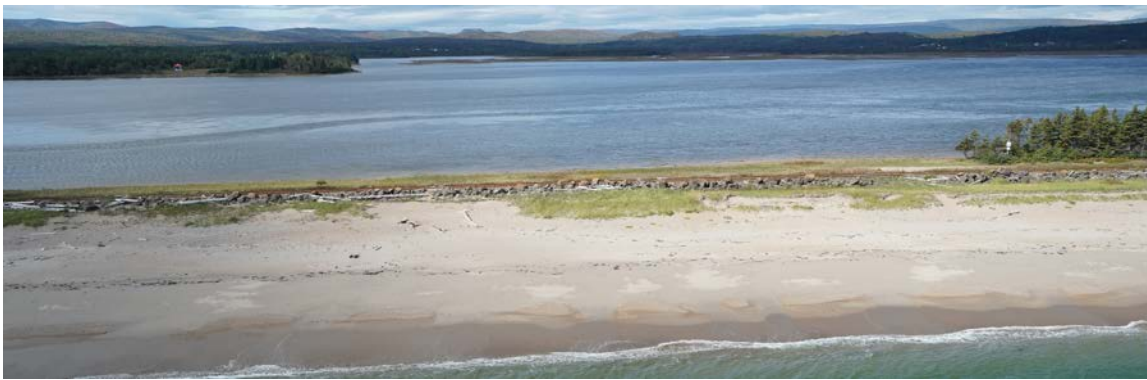
À Coin-du-Banc, la voie ferrée passe sur une flèche de sable submergée à plusieurs reprises par les hautes marées.

Le 23 août dernier, le gouvernement du Canada est venu appuyer le projet avec l'annonce d'une contribution financière de 45,8 millions de dollars principalement allouée aux travaux de réhabilitation et de reconstruction afin d'assurer la pérennité des infrastructures qui ont été les plus touchées par les tempêtes, les hautes marées et l'érosion côtière. Ces travaux seront réalisés au cours des 10 prochaines années.