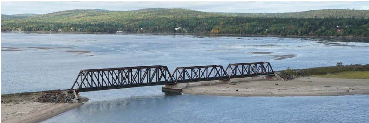
Le pont de Douglastown, soumis aux effets de l'érosion côtière.

Pour toute question ou tout commentaire, communiquez avec la :